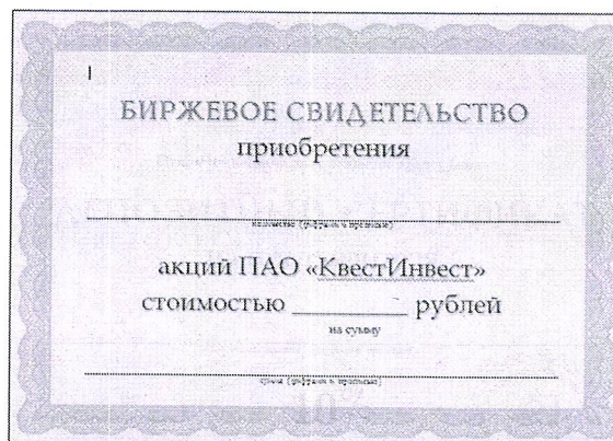
Рисунок 2 – Форма биржевого свидетельства

6. Бланки биржевых свидетельств приобретения ценных бумаг, отпечатанные на зеленой бумаге (рис. 2).