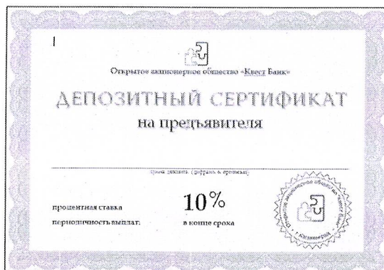
Рисунок 1 – Форма депозитного сертификата

5. Бланки депозитных сертификатов, отпечатанные на голубой бумаге (рис. 1).