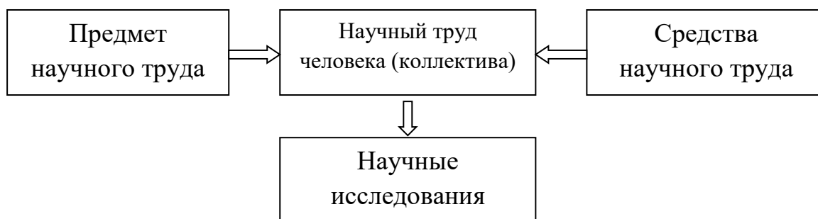
Рис. 1.1 Научные исследования

Научные исследования, как вид деятельности, базируются на трёх составляющих частях, неразрывно связанных между собой (рис. 1.1).