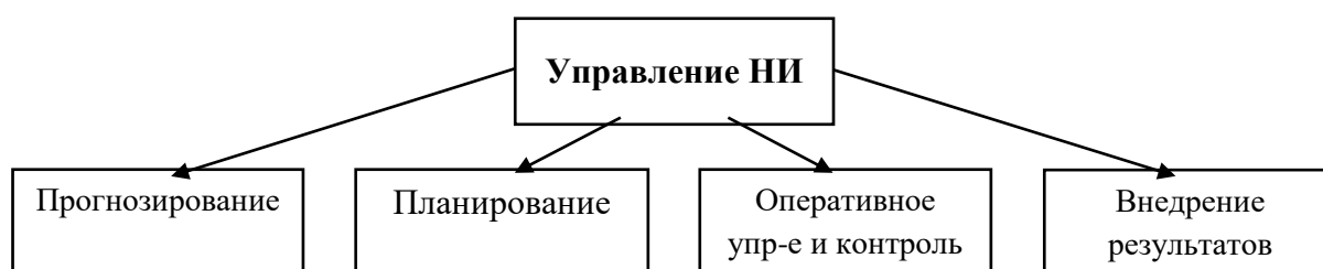
Рис. 5.1. Управление научными исследованиями

В широком смысле понятия управления научными исследованиями можно выделить четыре основных этапа (рис. 4.1).