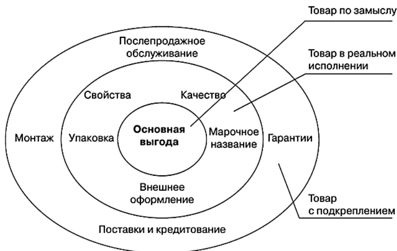
Рисунок 2 – Трехуровневая модель товара

Традиционно под товаром в экономических источниках рассматривается продукт, созданный для продажи. Ф. Котлер предложил расширенную модель товара, тем самым разработав Трехуровневую модель товара в маркетинге (рисунок 2). В качестве, так называемых уровней автор выделяет "товар по замыслу", "товар в реальном исполнении" и "товар с подкреплением".