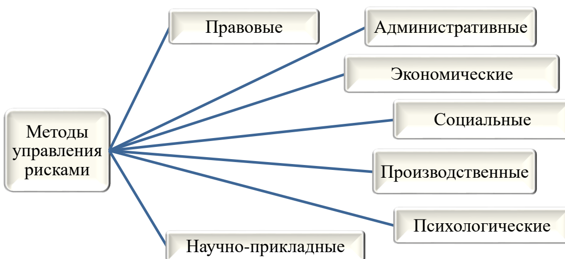
Рисунок 2 – Классификация методов риск-менеджмента с учетом их содержания

При изучении данного вопроса необходимо учесть классификацию методов риск-менеджмента с учетом их содержания (представлена на рисунке 2).