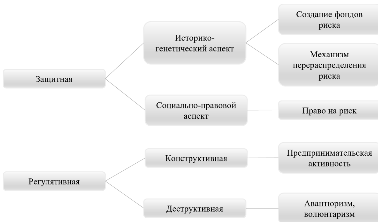
Рисунок 1 – Функции риска

компания должен быть ориентирован на дуалистическую природу риска и учитывать его функции (рисунок 1).