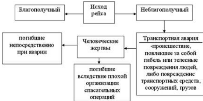
Рис. 16. Исход рейса Работа 7. Аварии на водном транспорте.

Работа 6. Факторы безопасности рейса Выпишите в тетрадь схему исхода рейса.