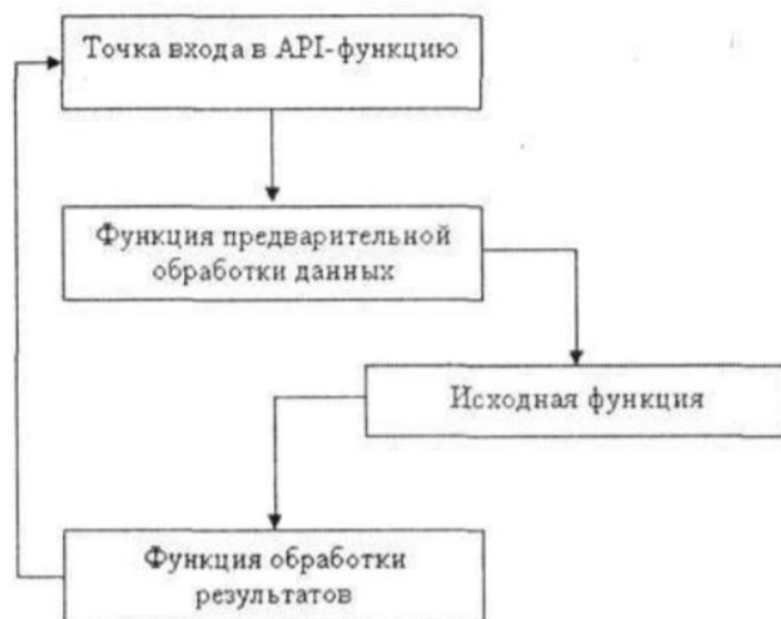
Рисунок 2 – Перехват API-функций