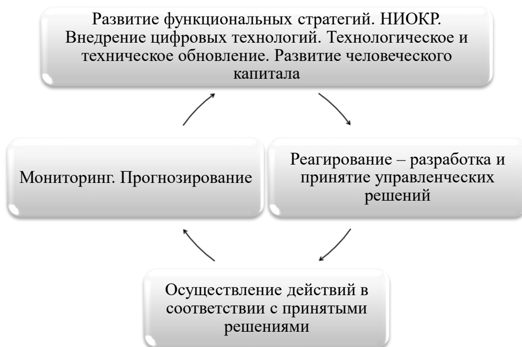
Рисунок 1 – Контур самонастройки в управлении

Изучение данного вопроса следует начать с понимания необходимости регулярного самостоятельного аудита своего ресурсного потенциала и стратегии своего развития на соответствие принципам экосистемности (рисунок 1).