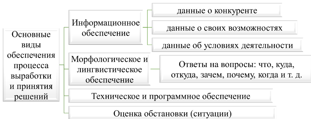
Рисунок 2 – Основные виды обеспечения процесса выработки и принятия решений

В изучении данного вопроса поможет понимание того, что процесс выработки решения – это процесс переработки информации о состоянии объекта управления в управляющую информацию. Основные виды обеспечения процесса выработки и принятия решений представлены на рисунке 2