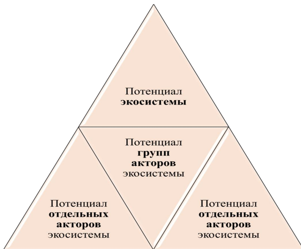
Рисунок 4 – Обобщенная структура потенциалов экосистемы