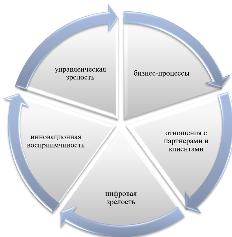
Рисунок 5 – Система сбалансированных показателей промышленной экосистемы

При изучении данной темы следует учесть, что устойчивость развития экосистемы можно оценить через интегральную оценку системы сбалансированных показателей промышленной экосистемы (рисунок 5).