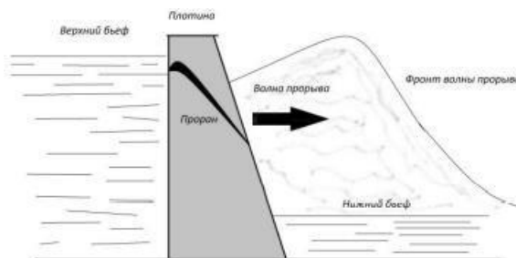
Рис 13. Схема распространения волны прорыва. Запишите действия населения до и после возникновения волны прорыва.

После прекращения подъёма наступает более или менее длительный период движения потока. Он будет тем длительнее, чем больше объём водохранилища (пока оттуда не вытечет вся вода). Спад уровня воды – последняя фаза образования зоны затопления.