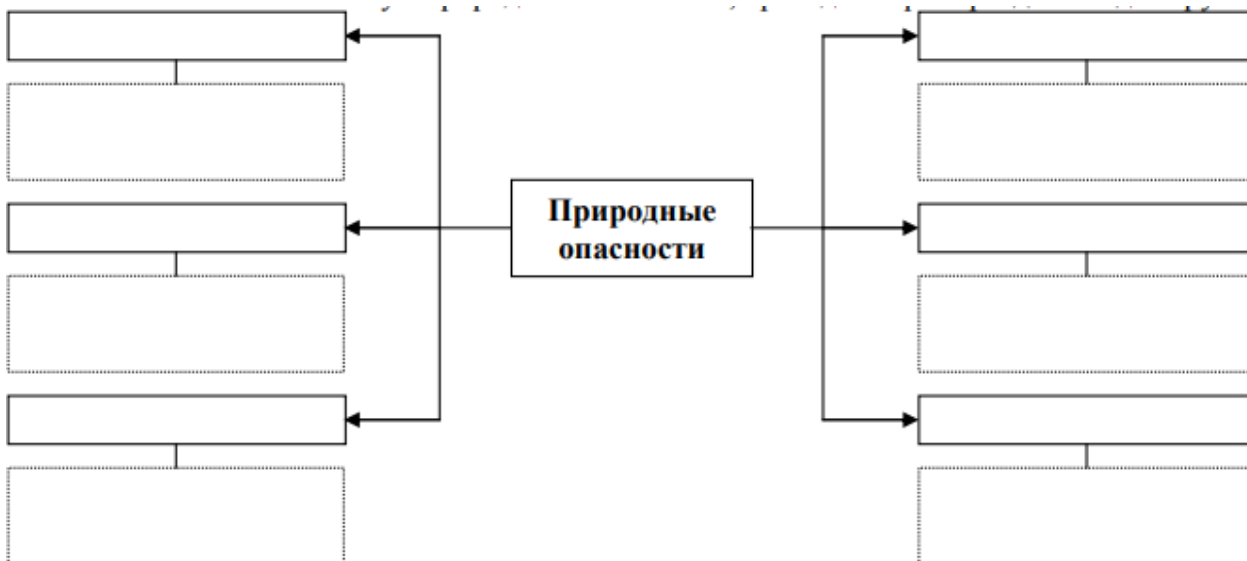
Рис. 2. Блок-схема «Природные опасности»

Заполните блок-схему «Природные опасности», приведите примеры для каждой группы.