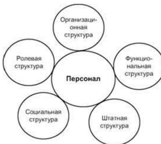
Рис. Структура персонала

Кроме представленной выше, структура персонала предприятия (рисунок) может быть рассмотрена и по другим признакам.