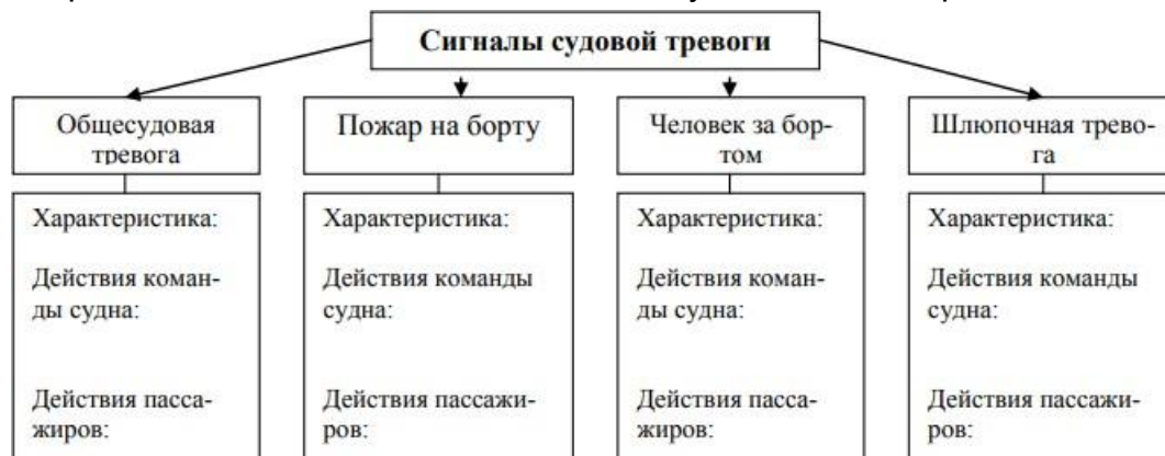
Рис. 17. Сигналы судовой тревоги

А) Используя учебную литературу, заполните блок-схему «Сигналы судовой тревоги», записав действия команды судна и пассажиров.