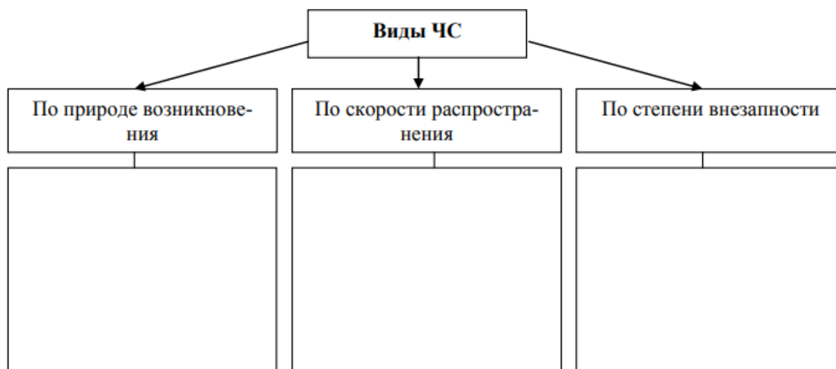
Рис 1. Схема классификации ЧС

Работа 1. Классификация чрезвычайных ситуаций (ЧС). Заполните схему классификации ЧС, приведите примеры.