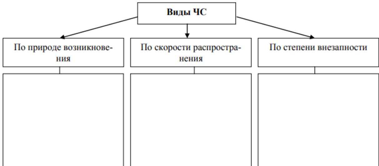
Рис 1. Схема классификации ЧС

Работа 2. Классификация ЧС по масштабу и тяжести последствий.