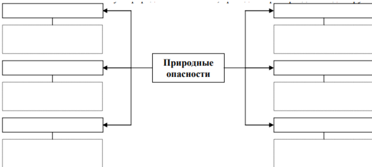
Рис. 2. Блок-схема «Природные опасности»

Заполните блок-схему «Природные опасности», приведите примеры для каждой группы.