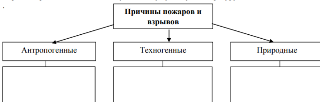
Рис. 14. Причины пожаров и взрывов Г) Заполните Таблицу 12, используя учебную литературу.

В) Назовите антропогенные, техногенные и природные причины возникновения пожаров и взрывов, заполните схему, используя учебную литературу.