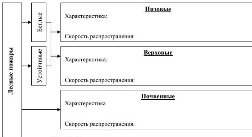
Рис. 11. Виды лесных пожаров по месту распространения

А) Заполните блок-схему «Виды лесных пожаров по месту распространения»