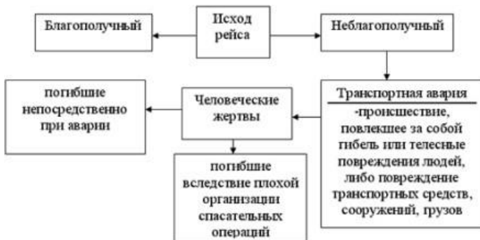
Рис. 16. Исход рейса Работа 7. Аварии на водном транспорте.

Работа 6. Факторы безопасности рейса Выпишите в тетрадь схему исхода рейса.