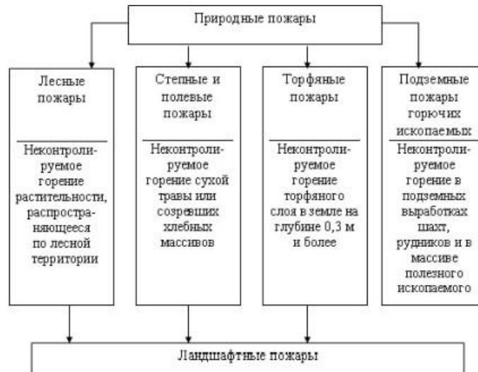
Рис. 10. Виды природных пожаров Б) Используя учебную литературу, заполните Таблицу 5.