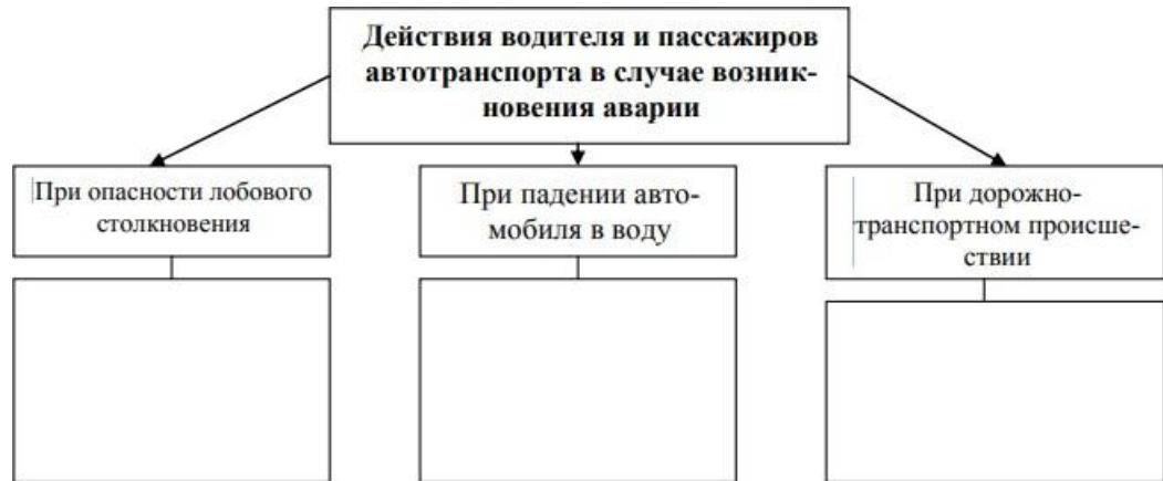
Рис. 15. Действия водителя и пассажиров автотранспорта в случае возникновения аварии Работа 4. Аварии на воздушном транспорте.

В) Заполните схему, записав действия водителя и пассажиров автотранспорта при возникновении аварии.